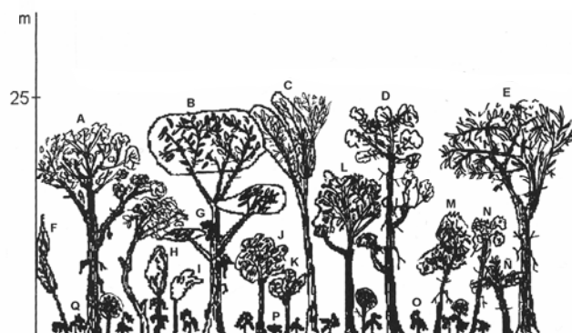
Figura 2. Estructura vertical de la vegetación del sistema agroforestal de montaña en Cuichapa, Veracruz. A) Cedrela odorata ; B) Ceiba pentandra ; D) Vochysia guatemalensis ; D) Sideroxylon Camiri Subs. Tempisque E) Heliconia carpos donnell-smithii ; F) Coccoloba barbadensis ; G) Sauravia sp.; H) Sauravia sp.; I) Aspidosperma megalocarpon ; J) Ateleia pterocarpa ; K) Cnidocolus sp.; L) Croton draco ; M) Diphysa robinoides ; N) Ateleia pterocarpa ; Ñ) Zanthoxylum sp.; O) Chamaedorea tepejilote ; P) Ch. olegans y (Q) Ch. sartorii .

gans ), la cual se adapta a lugares con mayor cantidad de luz.