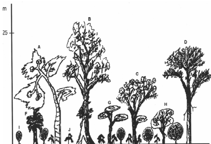
Figura 3. Estructura vertical de la vegetación del sistema agroforestal de lomerío en Cuichapa, Veracruz. A) Bursera sp.; B) Ficus sp.; C) Cedrela odorata ; D) Cordia alliodora ; F) Musa sp.; G) Zanthoxylum sp.; H) Sauravia sp.; I) Coffea arabica , y J) Chamaedorea sp.

la vegetación natural de montaña, las cuales son plantadas de manera sistemática. Aquí se obtiene entre 30 y 40% de la producción de follaje, aunque la hoja es de menor calidad por ser más pequeña, amarillenta y con mayor cantidad de daños que las hojas provenientes del monte, porque los cortes frecuentes no permiten la plena recuperación de la planta. En forma integrada se producen algunos cultivos agrícolas como maíz ( Zea mays L.), frijol ( Phaseolus vulgaris L.) y calabaza ( Cucurbita pepo L.).