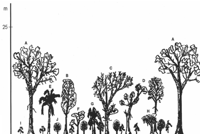
Figura 4. Estructura vertical de la vegetación del sistema agroforestal huerto familiar en Cuichapa, Veracruz. A) Cordia alliodora ; B) Mammea americana ; C) Cedrela odorata ; D) Hampea integerrima ; E) Cocos micifera .; F) Citrus sp.; G) Musa sp.; H) Annona sp.; I) Chamaedorea sp.; y J) Coffea arabica .

mercial de la palma camedor y todas las plantas en maceta se comercializan en pequeña escala como plantas de interior.