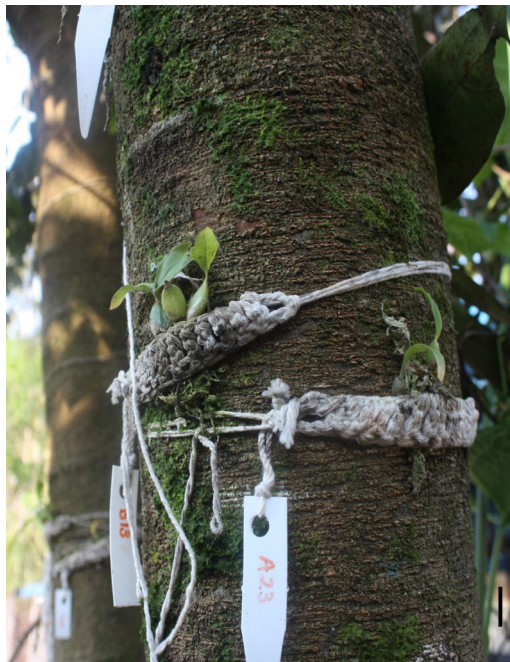
Figura 1. Plántulas aclimatadas de Lycaste aromatica (Graham) Lindl. establecidas en campo en árboles de Inga sp. Barra = 1 cm.

Las plantas obtenidas del sistema de medio semisólido y establecidas en sustrato peat moss Premier® con aplicación de Captan Plus® sobrevivieron al 100 %; sin embargo, Srivastava et al. (2015) no observaron diferencias significativas en los fungicidas con respecto al testigo, aunque las plantas sin aplicación de fungicidas en el sustrato peat moss Premier® sobrevivieron en menor