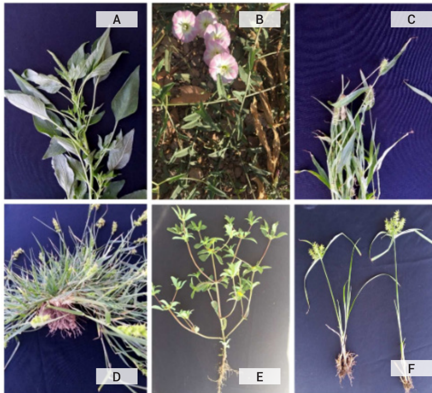
Figura 2. Arvenses colectadas difíciles de controlar en las parcelas, A) quelite ( Amaranthus hybridus ), B) correhuela ( Convolvulus arvensis ), C) pasto pega ropa ( Setaria adhaerens ), D) cadillo ( Cenchrus echinatus ), E) retama ( Flaveria trinervia ), F) coquillo ( Cyperus esculentus ).

patógenos completan su ciclo de vida en un hospedante alternativo (Félix-Gastélum et al. , 2017; Rebollar-Alviter et al. , 2001), varios insectos fitófagos o vectores de virus son atraídos hacia las arvenses debido a la liberación de volátiles (Baldelomar et al. , 2018; Martín-Loaiza y Céspedes, 2007; Muñiz-Merino et al. , 2014).