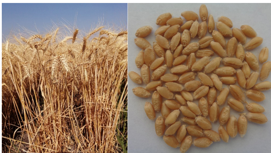
Figura 1. Porte de planta y grano de la variedad de trigo harinero Hans F2019.

La liberación de Hans F2019 servirá para sustituir al primer grupo de variedades testigo que aún se siembran en