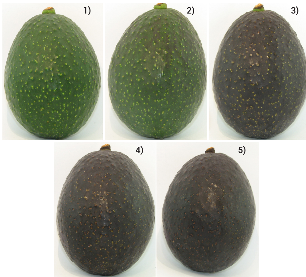
Figura 1. Escala de maduración de frutos de Méndez, según el cambio del color de la piel: 1) verde bosque; 2) fruto virado a negro (25 %); 3) fruto virado a negro (50 %); 4) fruto virado a negro (75 %); 5) fruto 100 % negro.

de manera aleatoria un código de tres dígitos. El panelista indicó su nivel de agrado de la pulpa en una escala hedónica de cinco puntos desde "me gusta mucho" a "me disgusta mucho". La descripción cuantitativa incluyó la evaluación del sabor, color, olor y textura. En el muestreo de fruto del 23 de agosto se realizó una prueba de preferencia de la pulpa entre los frutos procedentes de los cuatro huertos de Méndez. En este caso, el panelista asignó un valor entre 1 (el que más me agrada) y 4 (el que menos me agrada), según su preferencia (Obenland et al. , 2012).