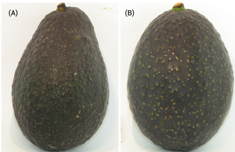
Figura 2. Forma del fruto de los aguacates Hass (A) y Méndez (B).

Cuadro 7. Nivel de agrado de la pulpa, en una escala hedónica de cinco puntos con un rango de “me gusta mucho” a “me disgusta mucho”, en frutos de aguacate Méndez procedentes de cuatro huertos (cosecha: 23 de agosto 2012).