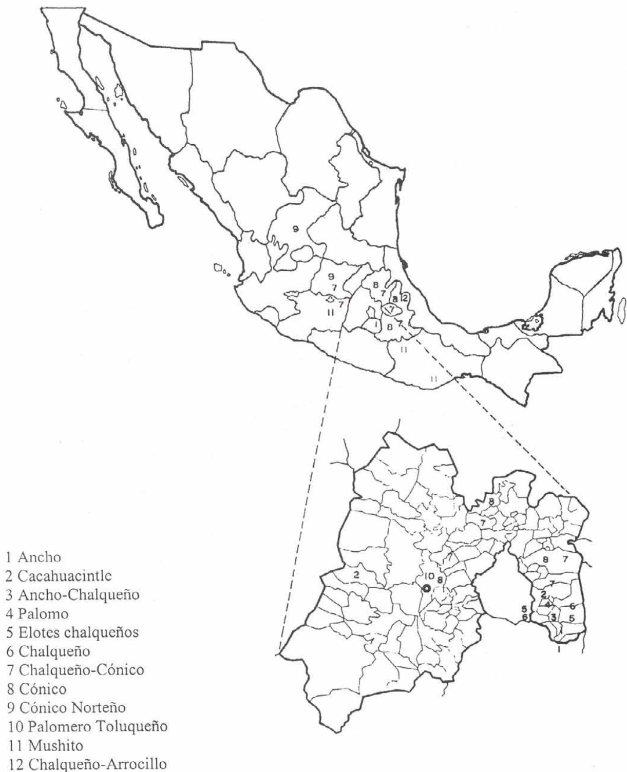
Figura 1. Distribución y relaciones de colectas de la raza Chalqueño y colectas típicas de otras razas del Altiplano Mexicano.