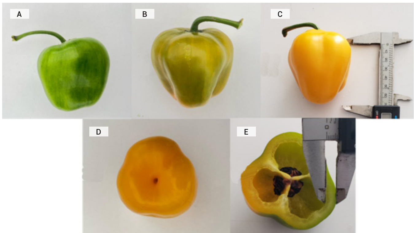
Figura 2. Características del fruto de chile manzano variedad Mayito. A) color verde claro al inicio de madurez, B) forma trapezoidal, C) color amarillo con intensidad media a la madurez, D) ápice poco profundo y E) predominantemente de tres lóculos.

1F), mientras que el estilo es de intensidad media. El fruto, al inicio de la madurez, es de color verde claro (Figura 2A) y tiene tamaño medio, con forma trapezoidal (Figura 2B), y a medida que madura su color cambia a amarillo con intensidad media (Figura 2C); el ápice es poco profundo