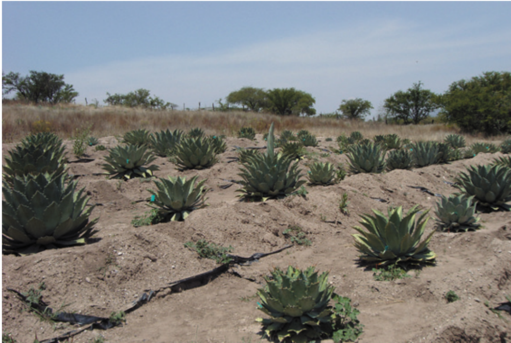
Figura 1. Plantación experimental de Agave potatorum Zucc. en San Pedro Yodoyuxi, Huajuapán de León, Oaxaca.

(sulfato de potasio). La distancia entre plantas fue de 2.5 m y de 3 m entre hileras, densidad equivalente a 1320 plantas \text{ha}^{-1} . Para cada planta se construyó una terraza individual de 1 \text{m}^2 , de sección circular, con un bordo de tierra de 15 cm de altura. La fertilización nitrogenada se hizo el 30 de junio de 2008, una vez que se estableció el periodo de lluvias; se empleó sulfato de amonio que se distribuyó al voleo en la terraza individual, alrededor de la planta, y se incorporó manualmente en los primeros 5 cm de la capa de suelo. El tratamiento de riego se inició el 15 de octubre de 2008, una semana después de haber concluido el periodo de lluvias. Con un recipiente debidamente aforado se aplicaron 10 L de agua por planta.