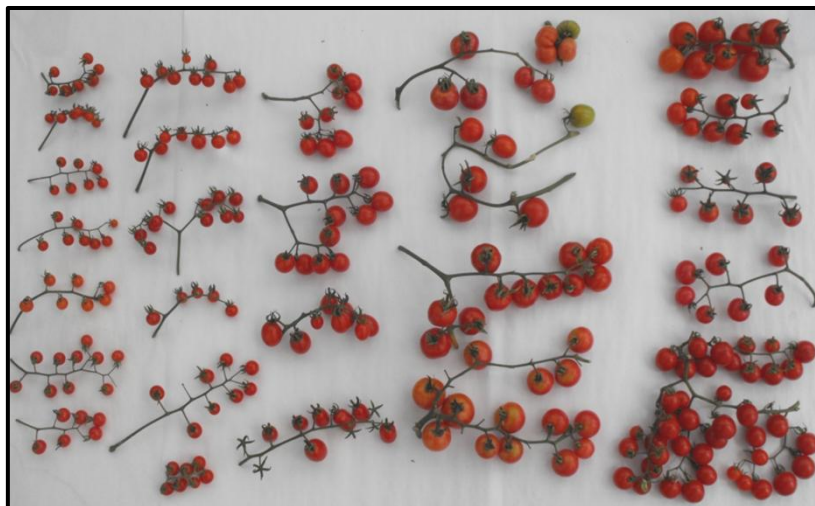
Figura 1. Frutos maduros de tomates silvestres del Estado de Oaxaca.

Las semillas de los frutos colectados fueron sembradas en invernadero y las plantas manejadas bajo el sistema de fertirrigación, durante el ciclo primavera-verano 2009 (marzo-junio), bajo un diseño experimental de bloques completos al azar con tres repeticiones, en la Ex-Hacienda Nazareno, Santa Cruz, Xoxocotlán, Oaxaca (96° 43’ LO, 17° 04’ LN, con altitud de 1519 m). Para los análisis de laboratorio, en cada parcela experimental se cosechó, entre el tercero y quinto racimos, una muestra de 200 a 400 g de frutos, y de la muestra se seleccionaron los frutos completamente rojos (estado de color 6 USDA), firmes al tacto y sanos, criterios basados en Raffo et al. (2002), como se ilustra en la Figura 1.