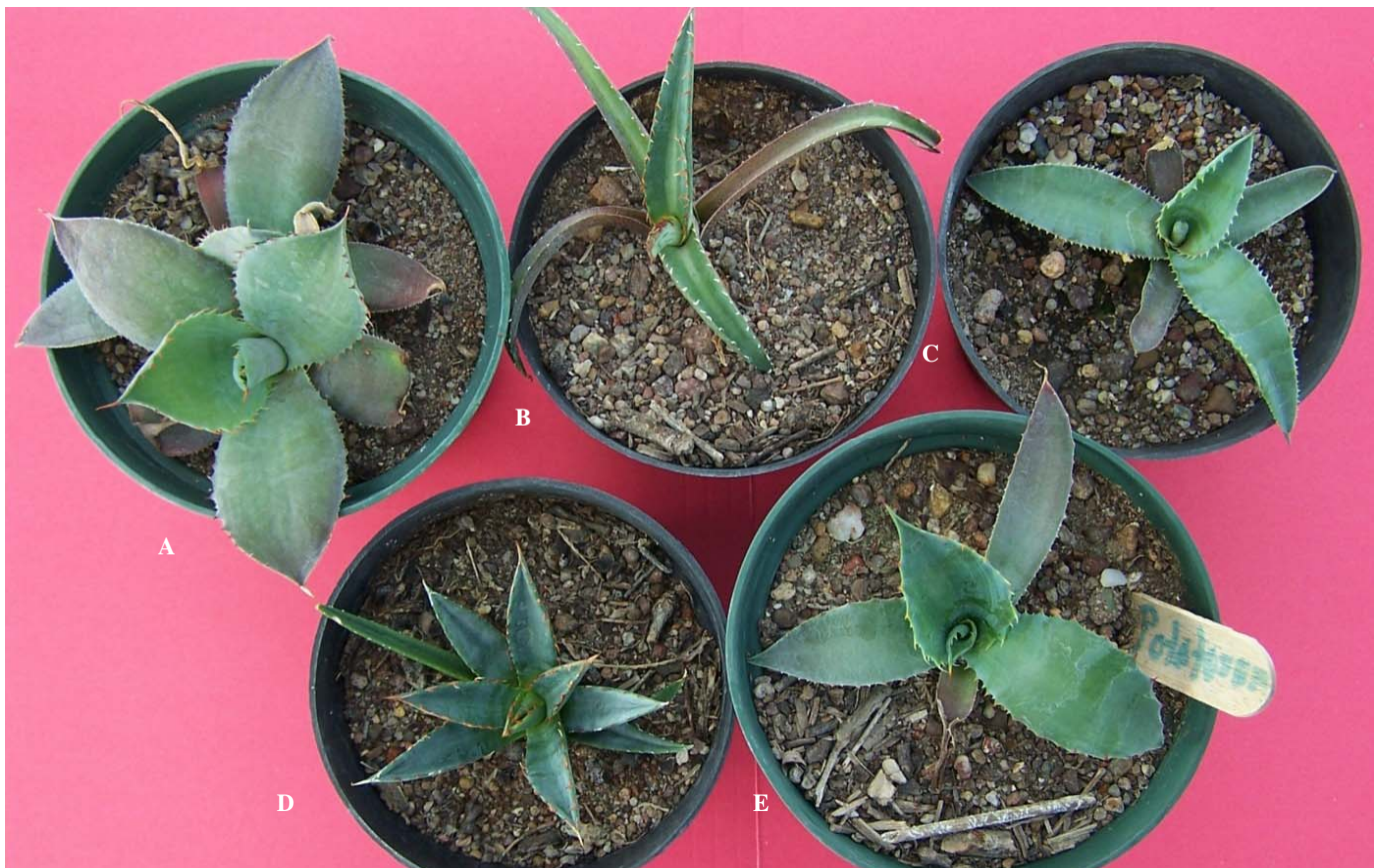
Figura 2. Plantas generadas in vitro creciendo en invernadero, a cuatro meses de su transferencia a suelo. A) Agave cupreata ; B) A. difformis ; C) A. karwinskii ; D) A. obscura ; y E) A. potatorum .