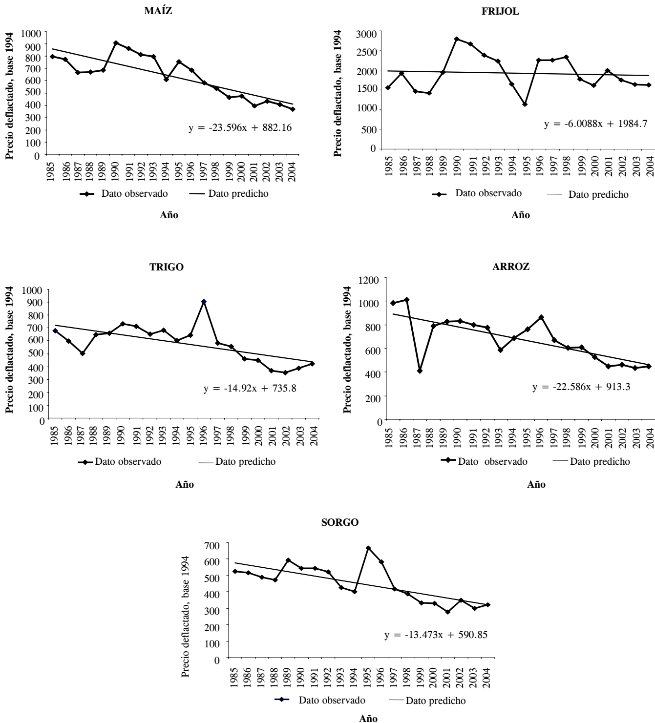
Figura 2. Tendencias de precios reales ($/t) de la canasta maíz, frijol, trigo, arroz y sorgo. México, 1986-2004. Fuente: Elaboración propia con base en datos de SIAP-SAGAQPA, OECD y PROCAMPO.